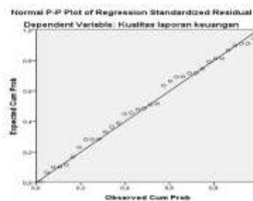
Gambar 1. Hasil Uji Normalitas

Uji Normalitas dengan one sample Kolmogorov Smirnov test di mana pengambilan keputusan adalah dengan melihat angka probabilitas signifikansinya. Data dikatakan normal apabila nilai signifikan > 0,05 .