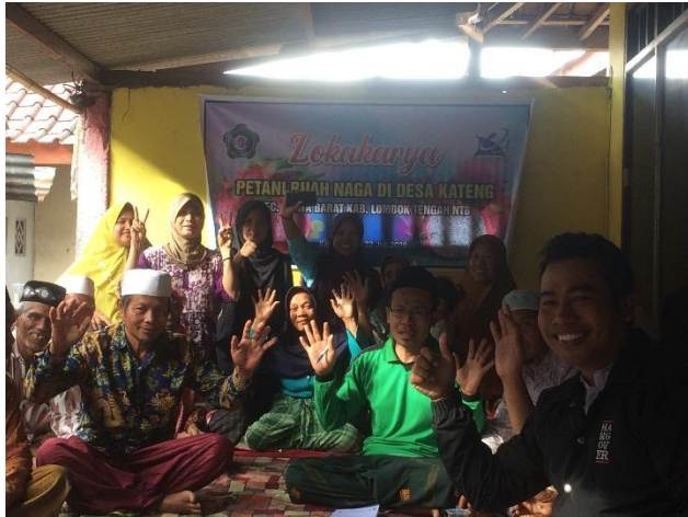
Gambar 10. Kegiatan Lokakarya

Foto dari kegiatan lokakarya adalah sebagai berikut: