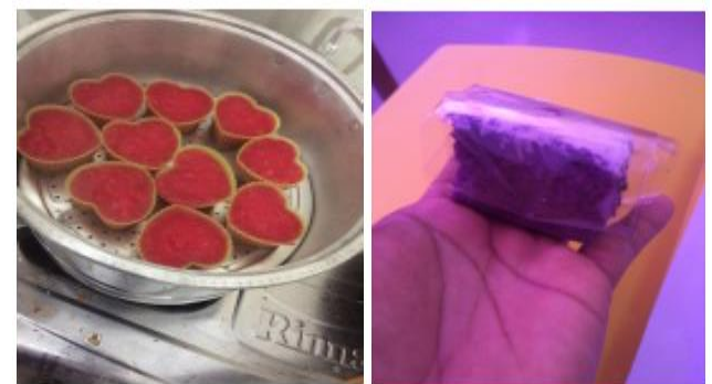
Gambar 13. Hasil pengolahan buah naga menjadi kue siap jual

Hasil dari olahan kue adalah sebagai berikut: