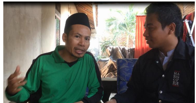
Gambar 5. Wawancara Ketua PKMS dengan ketua kelompok Tani Pade Pacu.

Manajemen/ tata kelola organisasi yang masih rendah di atasi dengan diskusi dengan ketua petani. Hasil diskusi adalah walaupun kelompok tani sudah ada ketua, sekertaris dan bendahara namun dalam aplikasinya tidak semua jabatan tersebut dilaksanakan sesuai dengan fungsi dan tugas masing-masing. Dalam pengabdian ini diberikan pengarahan fungsi dan tugas dari masing-masing jabatan yang dipegang dan diharapkan konsisten dalam aplikasinya. Dalam pengabdian ini juga dijabarkan tugas dari masing-masing jabatan mulai dari ketua kelompok tani sampai dengan bendahara. Berikut adalah proses wawancara antara ketua PKMS dengan ketua Kelompok Tani Pade Pacu pada hari Jumat tanggal 21 Juli 2019 pukul 14.00 WITA.