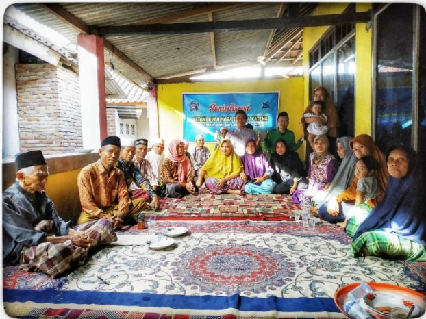
Gambar 7. Kegiatan Sosialisai Petani Buah Naga.

Petani masih kurang paham terkait dengan cara menanam yang baik dan benar seperti apa, organisasi yang masih minim pengetahuan (Tata Kelola Organisasi), hasil panen yang tidak mendapatkan harga pasar yang maksimal karena relasi dengan pengusaha dan pengepul masih kurang, hasil tani kebanyakan hanya dikonsumsi secara pribadi. Tindak lanjut dari hasil wawancara yang telah dilakukan ini adalah dengan diadakannya sosialisasi. Berikut adalah foto kegiatan sosialisasi terhadap petani buah naga di Desa Kateng Kec. Praya Barat Kab. Lombok Tengah Provinsi NTB.