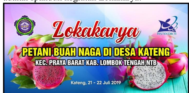
Gambar 9. Spanduk lokakarya 21-22 Juli 2019

Rendahnya SDM pada aspek keterampilan ( skil ) dan pengetahuan ( knowledge ) tentang proses penanaman sampai dengan pengolahan hasil oleh kelompok tani Pade Pacu metode yang digunakan oleh tim PKMS adalah dengan mengadakan Lokakarya pada tanggal 21-22 Juli 2019. Berikut adalah spanduk kegiatan Lokakarya: