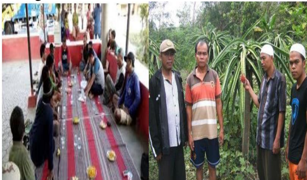
Gambar 1. Rapat koordinasi

Petani buah naga yang ada di lokasi pengabdian ini belum mempunyai pangsa pasar yang dapat menjamin pendapatan masyarakat yang ada di sana. Mitra petani buah naga ini tidak produktif secara ekonomi/ sosial padahal para petani memiliki lahan yang luas dengan struktur tanah yang sangat memadai untuk ditanami oleh pohon naga. Kurang mampunya masyarakat dalam memaksimalkan potensi tersebut menjadi salah satu kelemahan dari proses penanaman sampai dengan pengolahan hasil panen. Hasil panen nantinya kebanyakan dikonsumsi sendiri dan sedikit saja yang dibawa keluar desa untuk dijual. Pengalaman yang minim dan SDM yang kurang memadai menjadi salah satu faktor yang paling dominan dalam mensejahterakan masyarakat di sana. Berikut adalah beberapa foto petani buah naga di desa kateng: