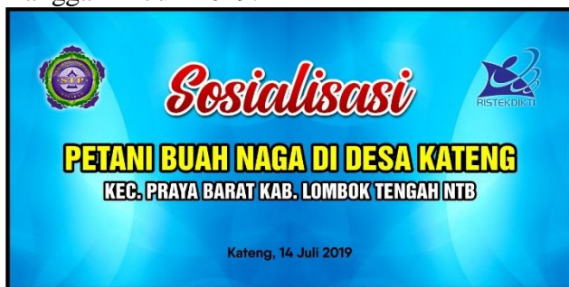
Gambar 8. Spanduk Sosialisasi 14 Juli 2019

Sosialisai dilaksanakan pada hari Minggu Tanggal 14 Juli 2019.