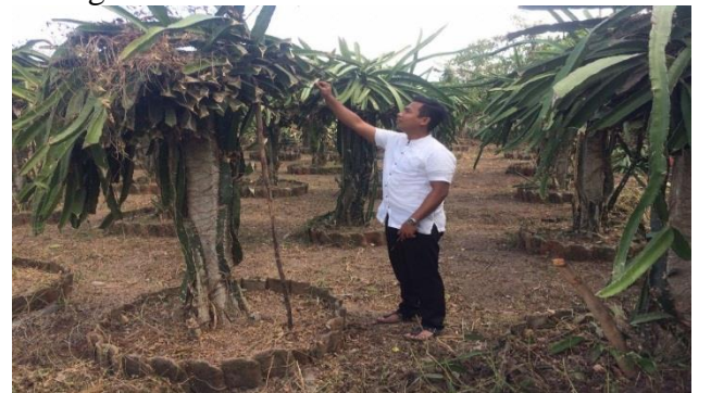
Gambar 6. Survey awal ke lokasi penanaman buah naga

Hasil dari wawancara ini adalah observasi awal terkait dengan bantuan yang dibutuhkan oleh kelompok tani pade pacu buah naga di desa kateng.