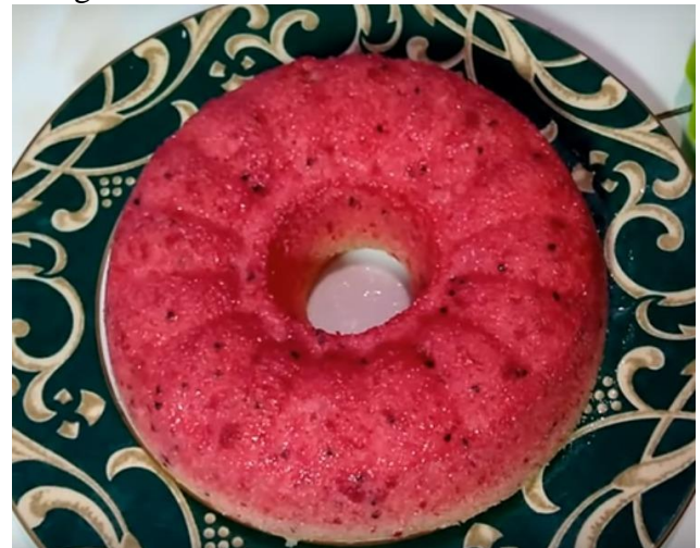
Gambar 12. Hasil pengolahan buah naga menjadi bolu

Hasil olahan bolu dari buah naga adalah sebagai berikut: