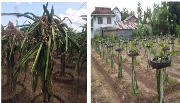
Gambar 3. Gambar Pohon Naga