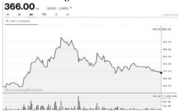
Gambar 1. Harga Saham PT Garuda 2018

kerjasama PT Mahata Areo Teknologi yang memiliki utang kepada maskapai berpelat merah dimasukkan kedalam laporan keungan yang seharusnya tidak dimasukan karena kerjasama ini selama 15 tahun dan dana belum diterima pada periode pelaporan tersebut.