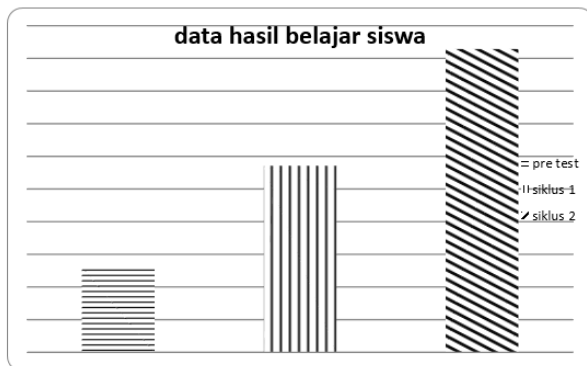
Gambar 2 Data ketuntasan hasil belajar siswa

Berdasarkan gambar 1 di atas, dapat dilihat peningkatan ketuntasan hasil belajar siswa dari siklus 1 ke siklus 2 sebesar 35,72%. Sedangkan peningkatan keaktifan siswa siklus dari siklus 1 ke siklus 2 sebesar 54,76%. Untuk data perbandingan hasil belajar siklus 1 dan siklus 2 bila dibandingkan dengan hasil belajar pada pre test dapat diamati pada gambar 2 berikut.